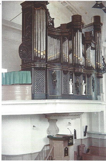
Harlingen, v.m. Doopgezinde Kerk.