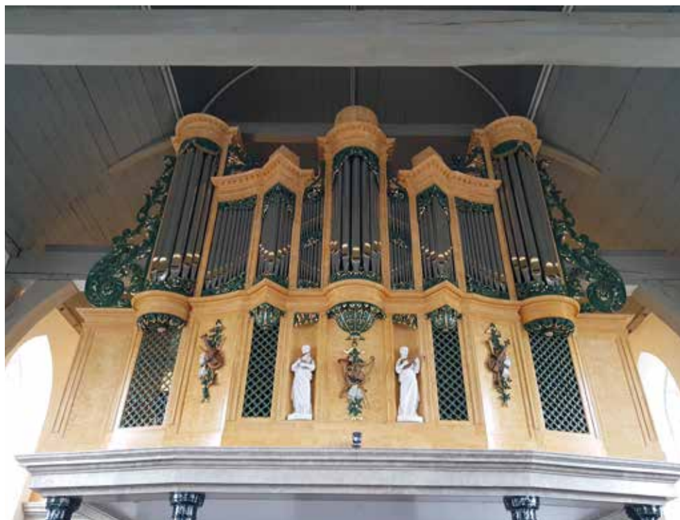
Het Van Gruisen/Van Oeckelen-orgel in de Oude Kerk te Soest.