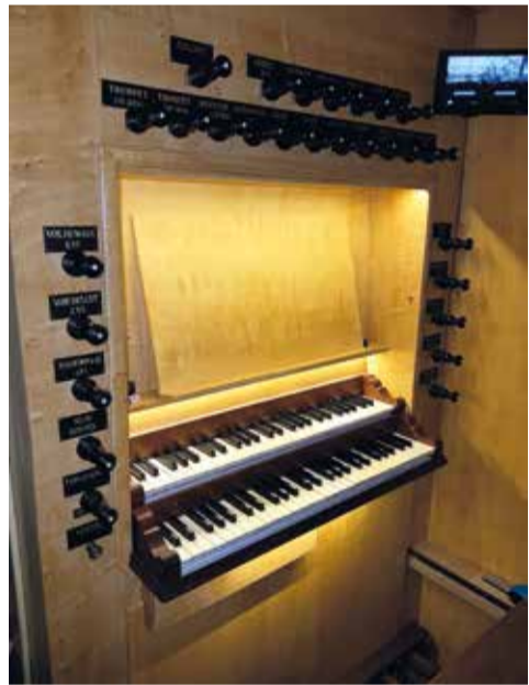
De claviatuur.

In het rapport dat orgelkundige Jan Jongepier in 1982 maakte wordt gesproken over de slechte bespeelbaarheid en de vervallen staat van het in principe zo fraaie instrument. Toen de Doopsgezinde Gemeente Harlingen in de jaren '90 besloot de oude kerk af te bre-