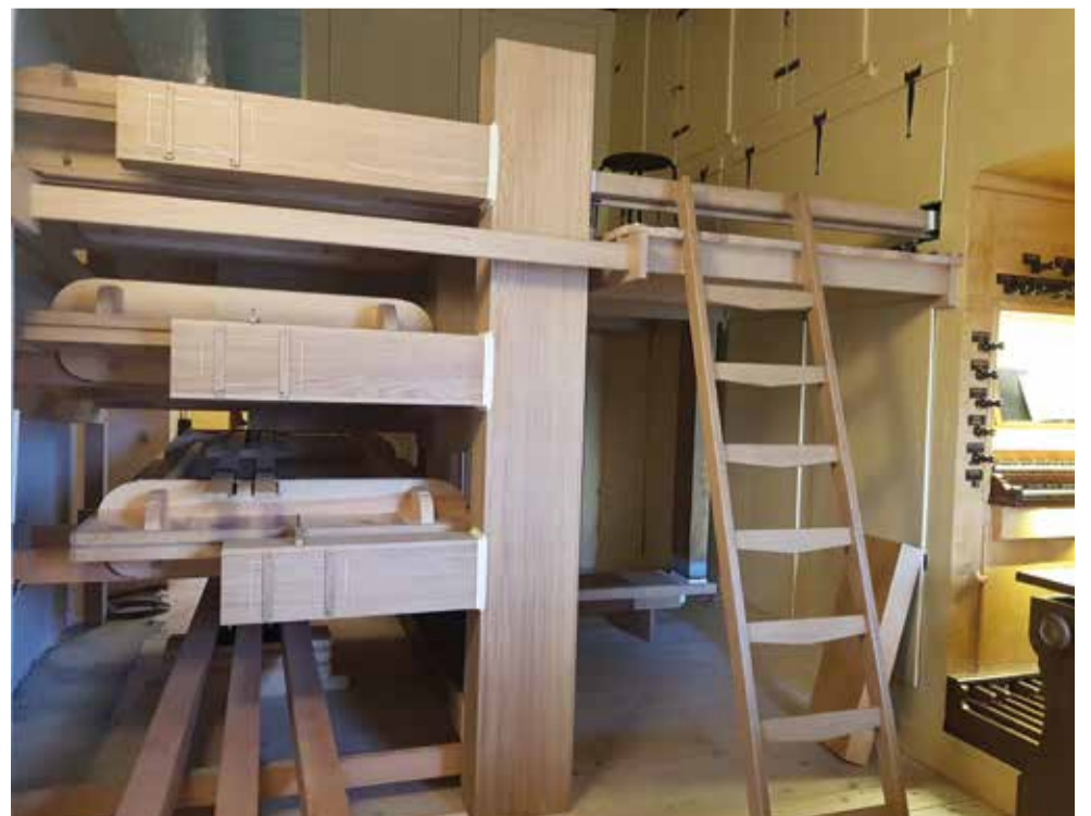
Het nieuwe balgenhuis.